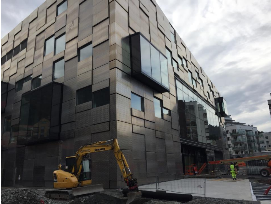
Spennende bygg med «røff» fasade, mye av uteområdene er allerede ferdigstilt