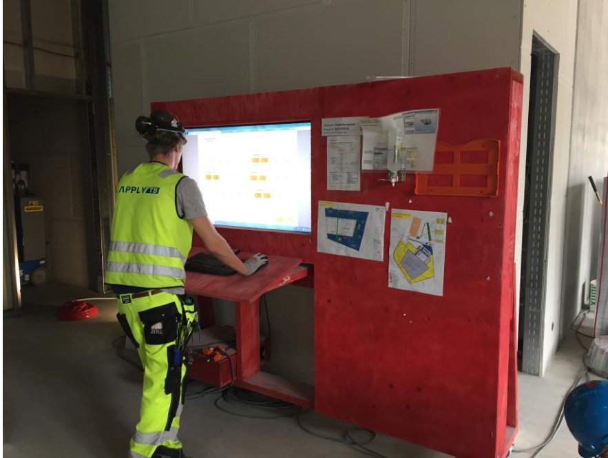
Og en av de mange BIM-kioskene som aktivt benyttes av fagarbeiderne under innredningsarbeidet