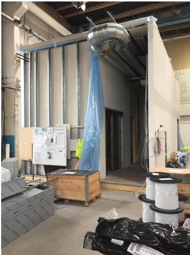
Prøverommet som ble bygget i lagerlokale ved siden av byggeplass for å teste løsninger og taktplanen